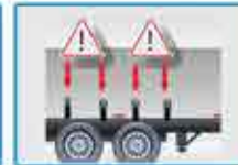
Sider y lonas bien amarrados