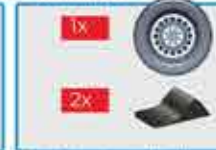
Verificar la rueda de repuesto y dos calzas por vehículo