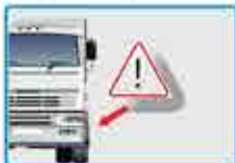
Luces delanteras, traseras e indicadores

Asegúrese que todas las luces y reflectores estén funcionando correctamente y que estén limpios!