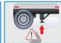
Patas de apoyo