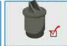
Elasticos, barra estabilizadora, amortiguadores y bujes; componentes de suspensión neumática