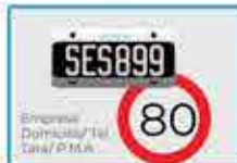
Patente, velocidad máx., dominio, tara y peso máximo (PMA)