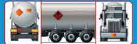
Señalizar al vehículo: Panel de seguridad y rótulos de riesgo

Si Usted transporta cargas peligrosas, asegúrese de tener lo siguiente: