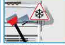
Quitar hielo del parabrisas