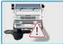
Observe posibles pérdidas

Verifique que los niveles de los fluidos coincidan con las indicaciones del fabricante!