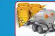
Revise su carga (ausencia de fugas, derrames y condición de mangueras, etc.)

Para combustible: llevar equipos adicionales requeridos por disposición SSC 76/97