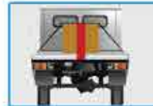
Correcta sujeción de la carga

Verifique la sujeción de la carga y la seguridad del vehículo!