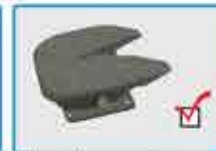
Plato de enganche