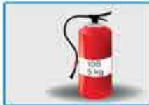
Matafuego (que corresponda)