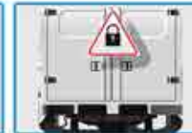
Unidad cerrada con llave o precintada