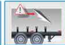
Unidad de transporte sin daños