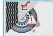
Condición del dibujo. Ausencia de cortes, abultamientos o desgaste de tela

Asegúrese que las ruedas y sistemas de suspensión estén en buenas condiciones!