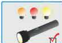
Focos, fusibles de repuesto y linterna