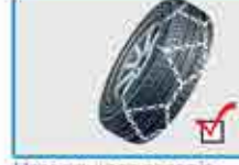
Usar equipos apropiados para las condiciones a transitar

Preste atención a las condiciones meteorológicas adversas!