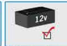
Batería, alternador y arranque