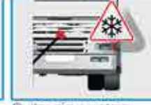
Quitar nieve y otras obstrucciones del radiador