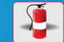
Llevar la cantidad y tipo de matafuego que corresponda a la carga