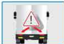
Luces laterales, de advertencia y reflectores