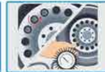
Presión de neumáticos y tuercas bien ajustadas; guardabarros.