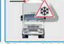
Quitar nieve y hielo del vehículo