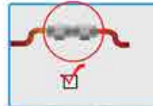
Conexiones de aire y eléctricas